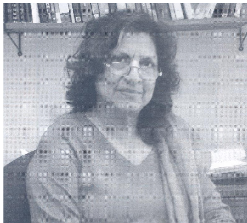
پرفسور فرہت معظم

از سال ۱۹۸۵ به بعد پرفسور فرہت معظم تحصیل کردہ امریکا (USA) در بیمارستان تازه تاسیس دانشگاه آفاخان کراچی شروع به کار کردند.