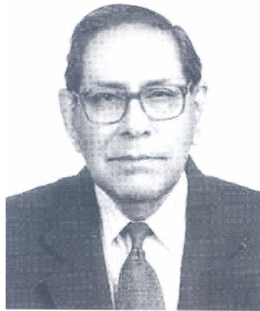
پروفیسور نظام الحسن

در همان سال دکتر نظام الحسن که در انگلستان آموزش جراحی کودکان دیده بودند بعنوان جراح کودکان افتخاری شروع بکار کردند و ایشان تمام فعالیت خود را صرف درمان کودکان نموده بطوریکه اولین جراح تمام وقت کودکان در پاکستان شناخته شده اند. دکتر امان اله خان در سال ۱۹۷۶ بازنشسته شده و پروفیسور نظام الحسن جای ایشان را گرفت و پروفیسور نظام الحسن نیز در سال ۱۹۹۱ بازنشسته شدند.