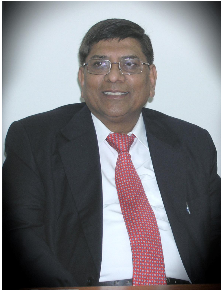
پروفیسور گوپتا- دهلی- هندوستان

رئیس انجمن آسیائی جراحان کودکان ۲۰۰۶-۲۰۰۸